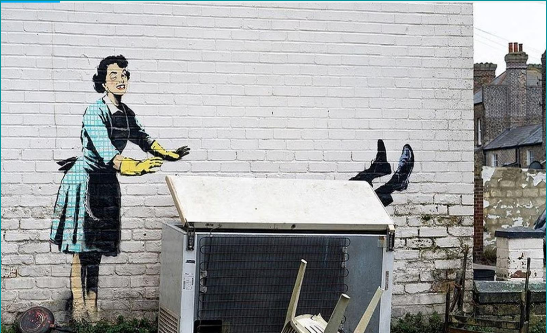
San Valentín, Banksy (Margate, Inglaterra)