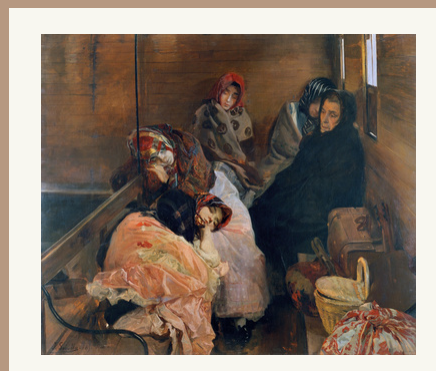
Joaquín Sorolla Bastida. Trata de blancas, 1984. Óleo sobre lienzo. Museo Sorolla, nº inv. OO320