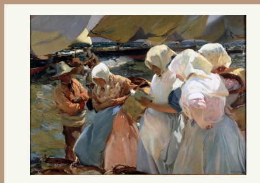
Joaquín Sorolla Bastida. Pescadoras valencianas, 1903. Óleo sobre lienzo. Diputación de Valencia, nº inv. 2412