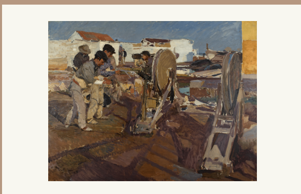
Joaquín Sorolla Bastida. Cordeleros, 1901. Óleo sobre lienzo. Museo Sorolla, nº inv. OO581