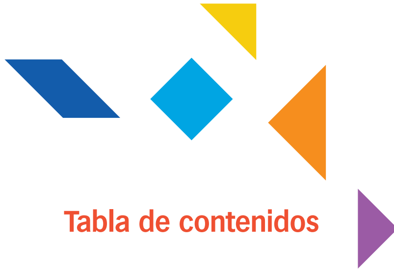
Tabla de contenidos