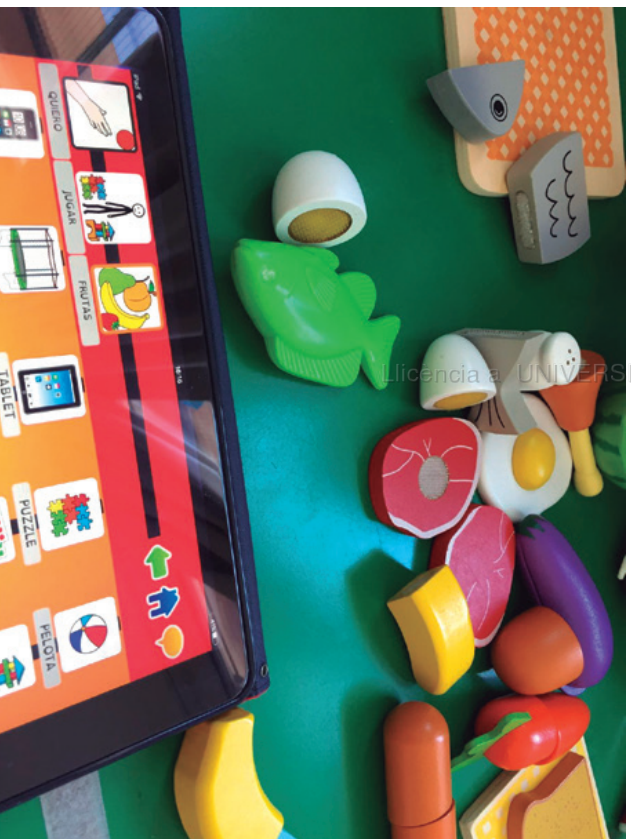
Imagen 3. Alumno haciendo uso de su comunicador de manera espontánea durante el juego

De 12:20 a 15:00 tiene lugar la rutina y el comedor educativo. Entre el alumno con TEA, es característico las intolerancias a ciertas texturas y sabores que les resultan desagradables. Teniendo en cuenta estas peculiaridades, que se convierten en necesidades nutricionales, desde el aula específica se informa e incluye formación a las monitoras sobre el programa de alimentación especial diseñado por el equipo Cyl.