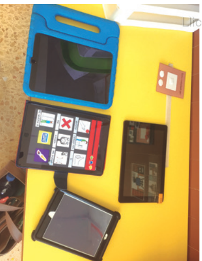
Imagen 1. Dispositivos móviles que utilizamos como herramientas de acceso a contenidos curriculares

individualizada y combinada de terapias especializadas en autismo (TEACCH, ABA, PECS), apoyada con tecnología.