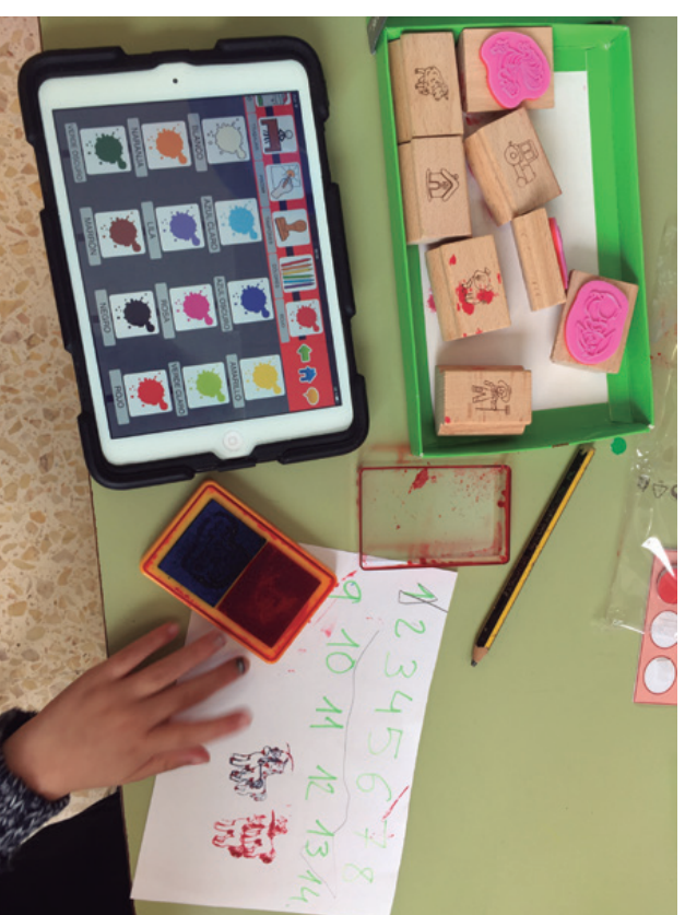
Imagen 2. Alumno haciendo uso de su comunicador para actividades didácticas