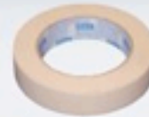
+ one yard tape