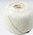
+ one yard string