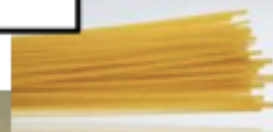
20 sticks of spaghetti