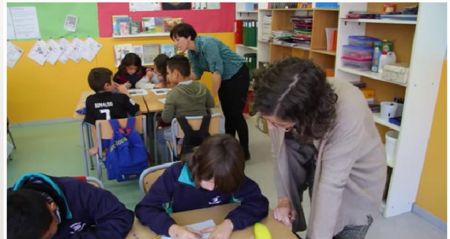
Docència compartida: Aprenentatge docent entre iguals per a l'atenció a la diversitat