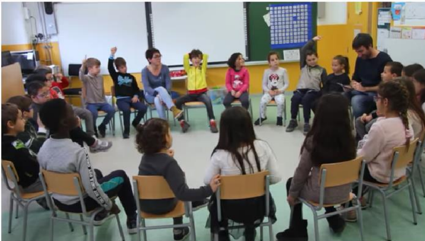
Docència compartida: Aprenentatge docent entre iguals per a l'atenció a la diversitat

Aprenentatge docent entre iguals per a l'atenció a la diversitat