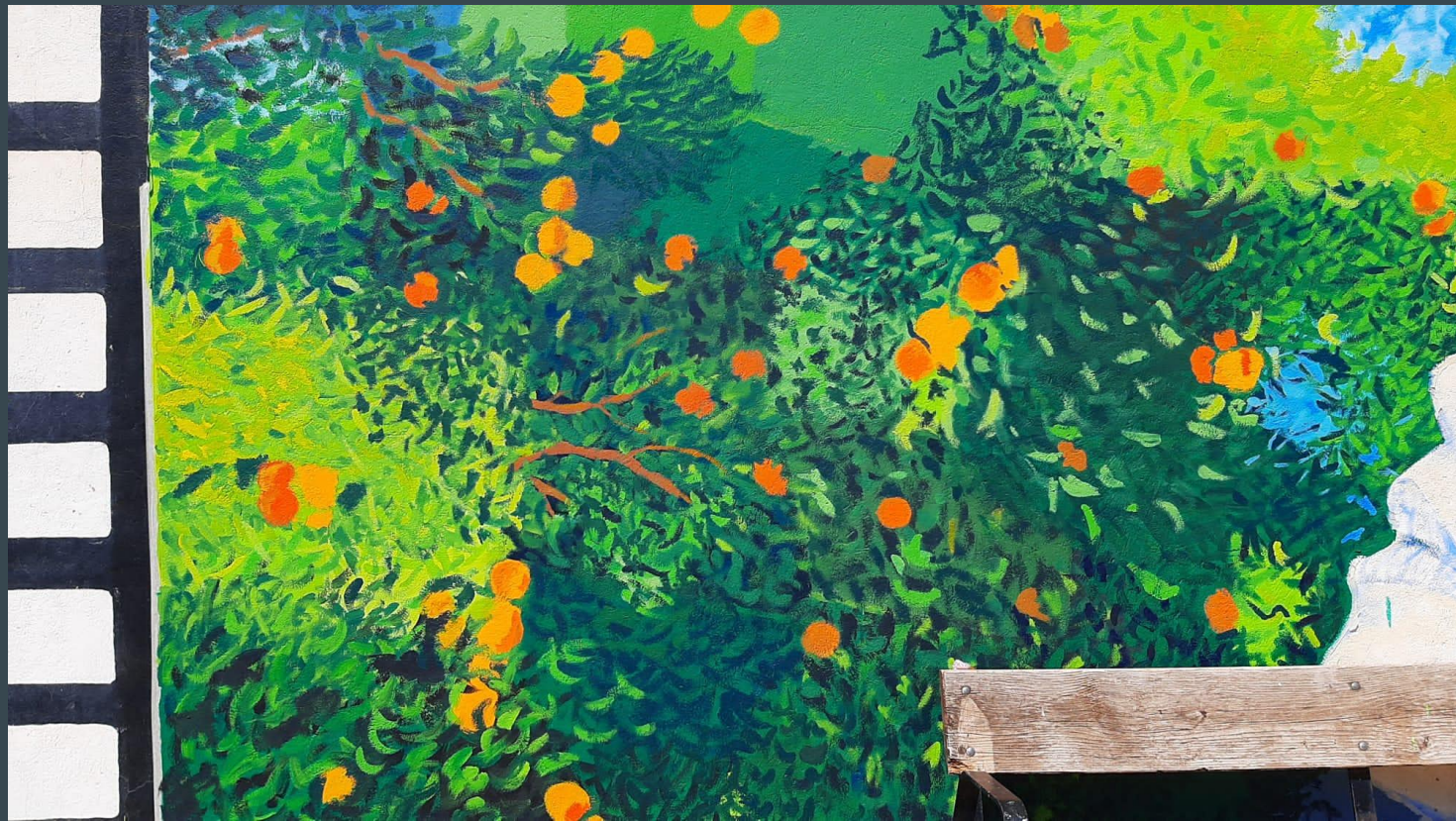
Homenatge a Joaquim Sorolla i la seua estada a Alzira, anys: 1902-1908 Es va centrar en pintar l'entorn dels camps de tarongers.