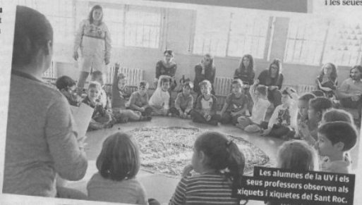
Les alumnes de la UV i els seus professors observen als xiquets i xiquetes del Sant Roc.

Un fet que ningú possa en dubte en esta escola pública de Silla, ja que durant els dies següents els xiquets i xiquetes d'Infantil assetjaran a la mestra d'Educació Física cada vegada que la vegem per saber quan tornaran a la seua classe.