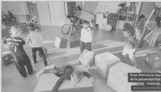
El joc lliure és la clau de la psicomotricitat vivencial.