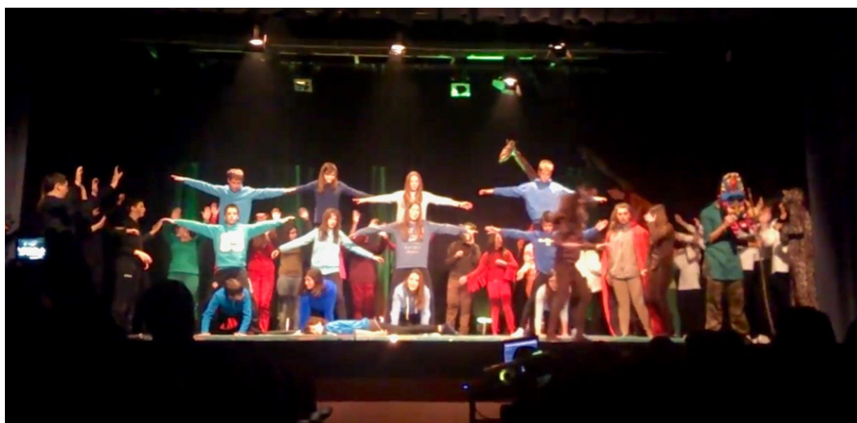
( Fig. 2 El meu alumnat; IES Vilafranca & IES Benassal, Vilafranca )

La creació d'una trama, la transformació d'un espai amb decorats i atrezzo, l'assoliment d'habilitats motrius, el treball de la condició física (força i ADM) i la salut