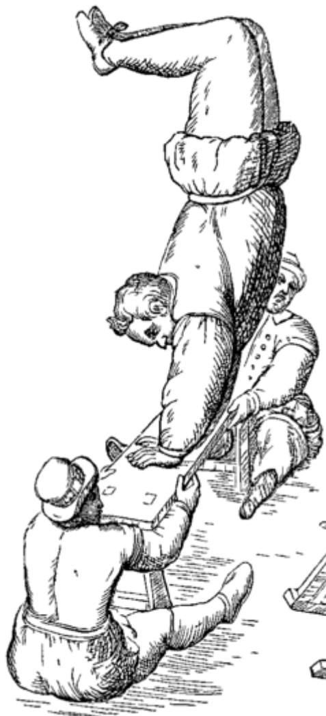
(Fig. 3 Tuccaro, 1599; Disponible mediante cc search)

Per altra banda, trobem el terme acrobalance com a art acrobàtic que combina elements d'Adagio (entés com a performance on una persona aguanta o alça una altra en diferents posicions) i Hand balancing (entés com a performance acrobàtica en la qual el cos canvia de posició o aguanta posicions equilibrant-se únicament amb una o ambdues mans). ➡