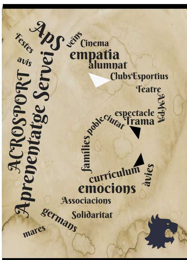
(Fig. 4 Word cloud; ApS & Lion, A. Escrig)

Com diu la cita hem de fer del nostre entorn una fortalesa. L'habilitat que tinguem com a docents en integrar l'educació física a la vida del nostre alumnat afavorirà un aprenentatge basat en contextos reals i propers a l'alumnat (González, 2014). L'escola ha de dissenyar situacions d'ensenyament que connecten el currículum amb les pràctiques socials i culturals del seu entorn per aconseguir un enfocament competencial real (Moya, 2008).