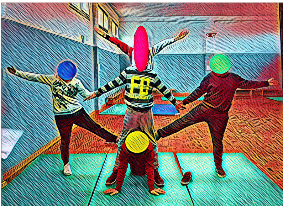
( Fig. 1 El meu alumnat; IES Marcos Zaragoza, La Vilajoiosa )