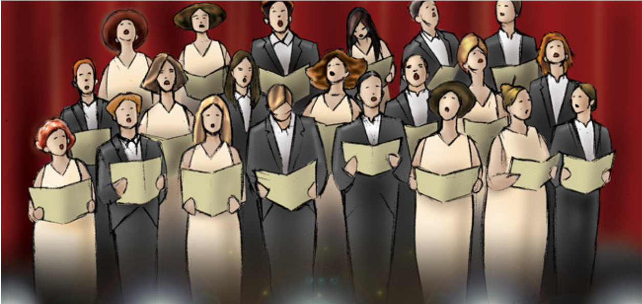
Figura 2. Coro mixto, en http://recursostic.educacion.es/bancoimagenes/web/

Un cor és el cant interpretat per varies persones. Si aquestes canten totes la mateixa melodia es diu que és un cor monòdic, mentre que si canten melodies diferents, tindrem un cor polifònic.