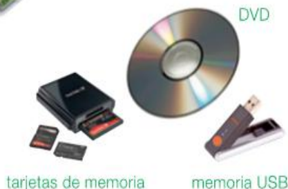
tarjetas de memoria

En los ordenadores se almacena mucha información, como textos y fotografías. Existen elementos para almacenar esa información fuera del ordenador y así poder pasarla a otros ordenadores.