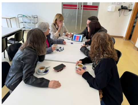
Imagen 2 - Sesión de trabajo.

Tras la bienvenida formal, el grupo realizó una sesión de trabajo con el personal del centro, para analizar las diferencias entre el sistema educativo español y portugués.