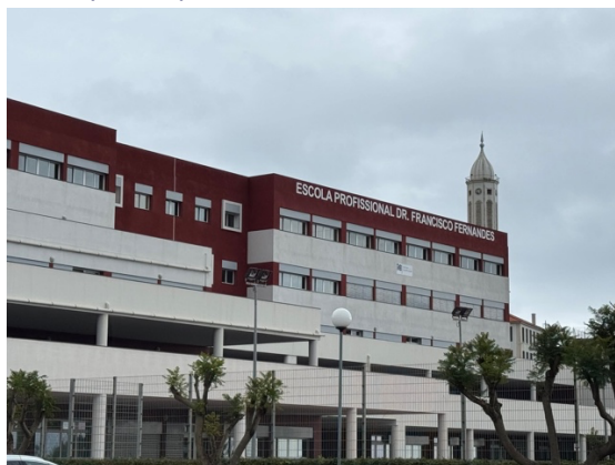
Imagen 6 - Exterior del centro.

Uno de los puntos clave discutidos durante la visita fue la estrecha relación que la escuela mantiene con el sector empresarial local. Esta colaboración garantiza que los estudiantes tengan la oportunidad de realizar prácticas profesionales en empresas relevantes, lo que les proporciona una valiosa experiencia laboral antes de graduarse. Esta vinculación entre la educación y el empleo fue especialmente interesante para el equipo del IES Cayetano Sempere, ya que les proporcionó ideas sobre cómo mejorar la conexión entre su formación académica y el mundo profesional.