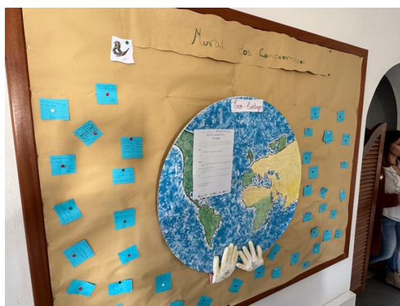
Imagen 8 - Mural de compromisos medioambientales.

El día comenzó con una interesante sesión informativa sobre sostenibilidad en la educación, en la que los responsables de la comisión de sostenibilidad del centro compartieron su enfoque hacia la formación de los estudiantes no solo en áreas técnicas, sino también en cómo ser conscientes de los desafíos medioambientales y sociales. Durante esta charla, se destacó la necesidad de incorporar la sostenibilidad como un eje transversal en los programas educativos, tanto en términos de contenido como en metodologías de enseñanza. Los docentes nos mostraron metodologías de aprendizaje colaborativo y de servicio, explicando, por ejemplo, su mural de compromisos medioambientales adoptados por el alumnado del centro: