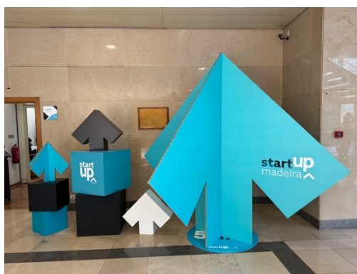
Imagen 14 - Visita a StartUp Madeira.

Para cerrar nuestra movilidad, realizamos una visita a Startup Madeira , un referente en la isla para apoyar a los emprendedores y empresas emergentes. Durante esta visita, tuvimos la oportunidad de conocer diversos programas de apoyo a emprendedores que impulsan la innovación y el desarrollo empresarial en la región. Además, nos presentaron casos de éxito de empresas emergentes que, con el respaldo adecuado, han logrado prosperar y contribuir al crecimiento económico local. Esta experiencia fue especialmente inspiradora, ya que pudimos observar de primera mano cómo las ideas de negocio se transforman en realidades exitosas, lo que reforzó nuestra visión sobre el papel del emprendimiento en la educación y la formación profesional.