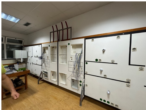
Imagen 7 - Taller de electricidad.

Uno de los puntos clave discutidos durante la visita fue la estrecha relación que la escuela mantiene con el sector empresarial local. Esta colaboración garantiza que los estudiantes tengan la oportunidad de realizar prácticas profesionales en empresas relevantes, lo que les proporciona una valiosa experiencia laboral antes de graduarse. Esta vinculación entre la educación y el empleo fue especialmente interesante para el equipo del IES Cayetano Sempere, ya que les proporcionó ideas sobre cómo mejorar la conexión entre su formación académica y el mundo profesional.