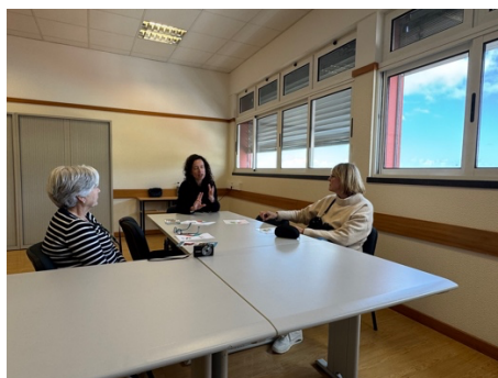
Imagen 13 - Sesión de trabajo.

Simultáneamente, el resto del equipo del IES Cayetano Sempere se dedicó a explorar la estructura organizativa del Centro de Formação Profissional da Madeira . Durante esta parte de la jornada, tuvieron la oportunidad de conocer más a fondo la logística de los programas formativos , el proceso de emisión de certificados y cómo gestionan las inscripciones en los cursos . Esta visita resultó particularmente útil para comprender la eficiencia de los procesos administrativos y académicos en un contexto educativo distinto al nuestro. Las reuniones con el personal administrativo les permitieron conocer las buenas prácticas en gestión académica , cómo estas facilitan el acceso de los estudiantes a la educación y formación continua, y cómo la estructura administrativa contribuye al éxito de la formación profesional.