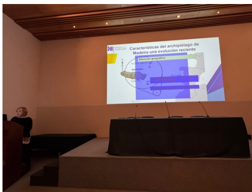
Imagen 1 - Presentación del centro de acogida.

fundamental para mejorar la calidad educativa y las oportunidades laborales de los estudiantes. En este sentido, el equipo expresó su interés en conocer más sobre los métodos de enseñanza aplicados en el CFPM, así como sobre los procesos administrativos que realizan.