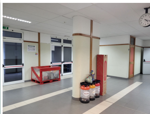
Imagen 10 - Iniciativas de reciclaje del centro de acogida.

Como reconocimiento a su compromiso con la sostenibilidad y el medio ambiente, el Centro de Formação Profissional da Madeira (CFPM) recibió el prestigioso certificado ECO-ESCOLAS . Este reconocimiento es otorgado a las instituciones educativas que demuestran un fuerte compromiso