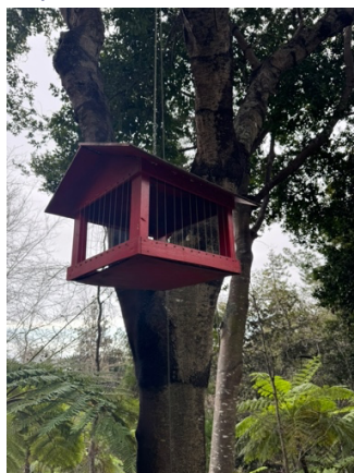
Imagen 9 - Caseta de pájaros del centro de acogida.

Asimismo, abordaron diversas áreas en las que el CFPM ha logrado integrar la sostenibilidad, incluyendo su infraestructura y el diseño de sus instalaciones. En cuanto a la arquitectura del centro, se mencionaron diversas medidas ecológicas implementadas en los edificios, como el uso de materiales sostenibles en la construcción, el aprovechamiento de la luz natural, y la instalación de sistemas eficientes de energía solar. Estas decisiones no solo contribuyen a la reducción de la huella de carbono de la institución, sino que también ofrecen un entorno educativo que enseña a los estudiantes sobre la importancia de la sostenibilidad en la vida diaria y en su futuro profesional. Asimismo, se mostraron otras iniciativas sostenibles, como los puntos de reciclaje disponibles por el centro, así como el reciclaje de virutas metálicas de los talleres y de los lubricantes usados.