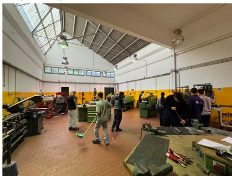
Imagen 3 - Taller de mecanizado.

Después de un agradable almuerzo, el equipo del IES Cayetano Sempere participó en una enriquecedora sesión sobre igualdad de género organizada por la Associação Womaniza-te, dirigida a todo el alumnado del Centro de Formação Profissional da Madeira (CFPM). Durante esta sesión, se discutió cómo la perspectiva de género se integra en la Formación Profesional (FP), abordando los desafíos y avances en la creación de entornos educativos inclusivos que fomenten la igualdad de oportunidades para todos los estudiantes, independientemente de su género. Fue una charla dinámica y participativa, donde tanto los docentes como los estudiantes compartieron sus experiencias y puntos de vista, lo que permitió crear un diálogo abierto y constructivo sobre este tema tan relevante.