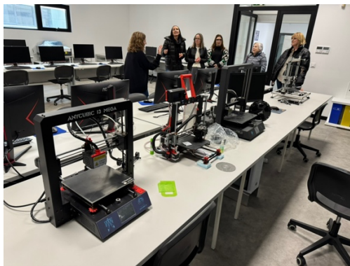
Imagen 5 - Taller de impresión 3D (CF Mecanizado).

La jornada continuó con la visita al Escola Profissional Dr. Francisco Fernandes , una institución educativa destacada en Madeira que ofrece formación profesional de alta calidad y que pertenece a la institución visitada. Esta visita fue una oportunidad para profundizar en las metodologías y enfoques pedagógicos utilizados en esta escuela, que se centra en la formación técnica de los estudiantes en diversas áreas, incluyendo las ciencias aplicadas y la tecnología.