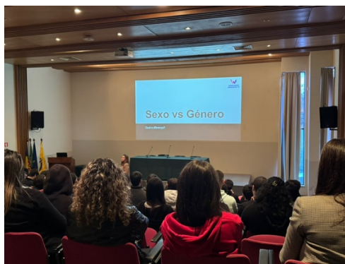
Imagen 4 - Sesión sobre igualdad de género.

Después de un agradable almuerzo, el equipo del IES Cayetano Sempere participó en una enriquecedora sesión sobre igualdad de género organizada por la Associação Womaniza-te, dirigida a todo el alumnado del Centro de Formação Profissional da Madeira (CFPM). Durante esta sesión, se discutió cómo la perspectiva de género se integra en la Formación Profesional (FP), abordando los desafíos y avances en la creación de entornos educativos inclusivos que fomenten la igualdad de oportunidades para todos los estudiantes, independientemente de su género. Fue una charla dinámica y participativa, donde tanto los docentes como los estudiantes compartieron sus experiencias y puntos de vista, lo que permitió crear un diálogo abierto y constructivo sobre este tema tan relevante.