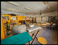
AULA DE MÚSICA