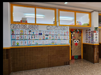
AULA DE INGLÉS