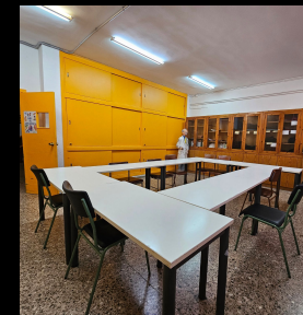
AULA DE CONVIVENCIA