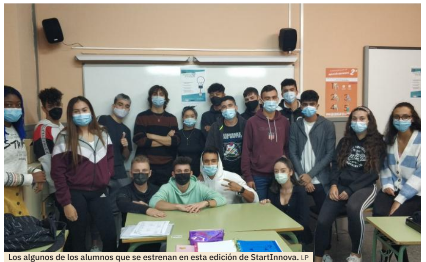
Los alumnos de los grupos que se estrenan en esta edición de StartInnova.

«El objetivo, participando en este concurso, es formar a los alumnos del Grado Medio de Actividades Comerciales en habilidades sociales y cualidades como adaptación a los cambios, persistencia, responsabilidad, iniciativa emprendedora y en definitiva prepararlos para un mundo laboral, donde las empresas buscan jóvenes que sepan adaptarse a los cambios del mercado ofreciendo soluciones in-