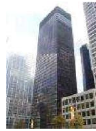
Edificio Seagram (Mies van der Rohe). Símbolo del mundo industrial contemporáneo. Carece de decoración. Su belleza es fruto de su pureza simétrica.