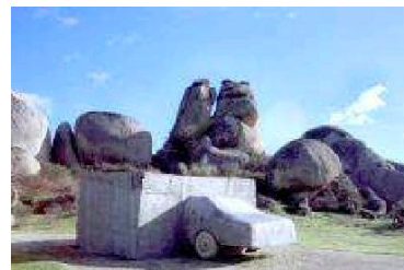
V.O.A.E.X., de Wolf Vostell - Malpartida de Cáceres

-Expresionismo abstracto - Action Painting: lo que importa es el acto de pintar, obras de gran formato con predominio del color, diversidad de texturas y materiales.