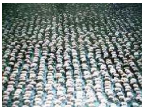
Instalación organizada por Spencer Tunick en el Zócalo de la Ciudad de México

Happening - Fluxus: Manifestaciones artísticas en el exterior interactuando con el espectador