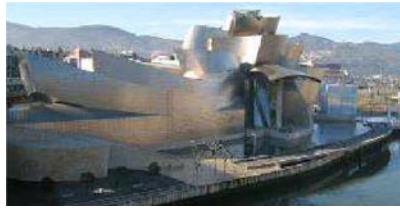
Museo Guggenheim Bilbao, España. (Frank Gehry)