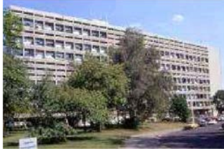
Unidad habitacional (Le Corbusier) Viandas en Berlín (Alemania)

como Norman Foster o Frank Gehry. Ejemplo: el Museo Guggenheim de Bilbao.