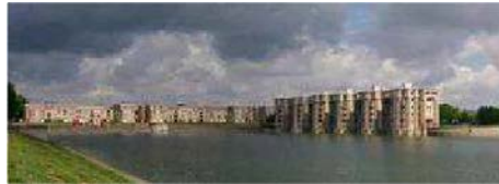
Arcades Du Lac (Francia), Ricardo Bofill