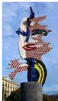
Barcelona's Head, de Roy Lichtenstein ubicada en el Paseo Colón (Barcelona).