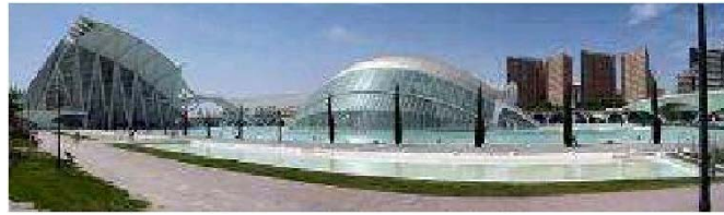
Ciudad de las Artes y las Ciencias (Valencia), Santiago Calatrava