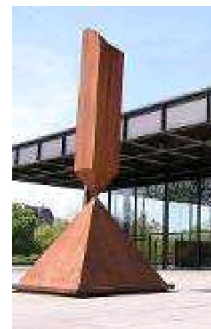
Obelisco roto, en el exterior de la Neue Nationalgalerie de Berlín de Barnett Newman

Happening - Fluxus: Manifestaciones artísticas en el exterior interactuando con el espectador