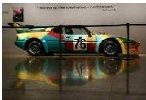
BMW decorado por Andy Warhol