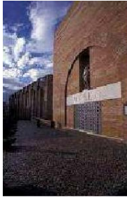
Museo Nacional de Arte Romano (Mérida), Rafael Moneo