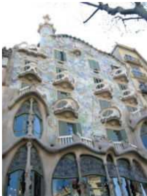
Casa Batlló de Gaudí . La fachada es ondulada, está recubierta con cerámica y la decoración es vegetal y en los balcones orgánica, pues simulan una especie de fémures