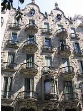
Casa Calvet de Gaudí , con líneas ondulantes. La fachada está adornada con motivos vegetales y mitológicos

Surge a finales del siglo XIX. Es un estilo decorativo, destacando los motivos ondulantes y vegetales. Destacaron el español Antonio Gaudí , el belga Víctor Horta y el francés Héctor Guimard.