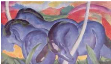
1. Caballos azules, de Franc Marz, los sentimientos son expresados a través del color.