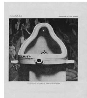
3. Fuente, de Marcel Duchamp, cualquier objeto, como este urinario, es considerado una obra de arte.