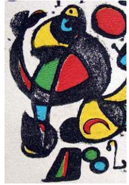
Miró , con lunas, círculos, ojos y el uso de sus fuertes colores característicos.