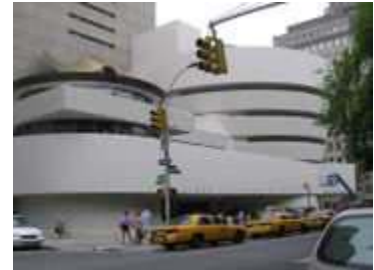
Museo Guggenheim de Nueva York, obra de Lloyd Wright , diseñado en espiral

Aparece en la década de los 30 y se contrapone a la racionalista, pues se interesa más por el interior de los edificios que por el exterior. Frank Lloyd Wright fue su principal representante, con obras integradas en el paisaje y adaptadas a las necesidades del hombre.