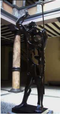
Pablo Gargallo, El Profeta. Fíjate cómo utiliza los espacios huecos, aunando el cubismo con un tema tan tradicional como el bíblico.

Es sobre todo abstracta, con materiales como hierro, cristal o madera. Importantes escultores son Pablo Gargallo, autor de "El Profeta" y Julio González.