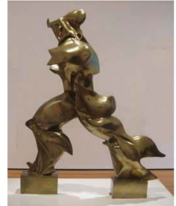
Humberto Boccioni expresa magistralmente el movimiento.