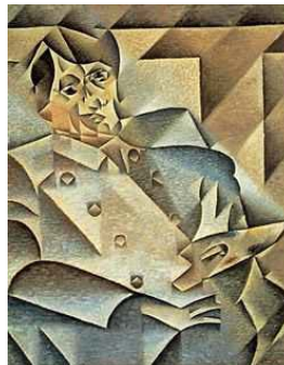
2. Retrato de Picasso, de Juan Gris, distintos puntos de vista a un tiempo de una misma figura.