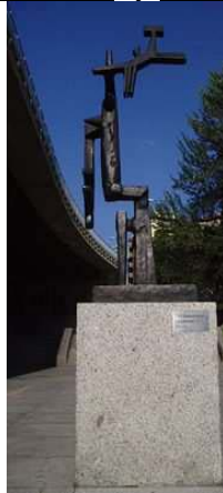
Julio González, La Petite Faucille, abstracta, donde el autor dibuja en el espacio, jugando con el volumen y los espacios vacíos.