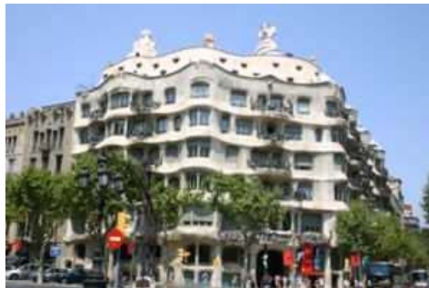
Casa Milá de Gaudí . La fachada es ondulante y la parte superior está cubierta de azulejos blancos, simulando una montaña nevada