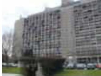
Unidad de habitación de Le Corbusier : líneas rectas, formas puras.

Fue introducida por Le Corbusier . Se trata de edificios de líneas rectas y formas puras