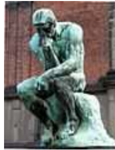
El pensador, de Auguste Rodin, muestra los efectos de la luz sobre una superficie aparentemente inacabada.