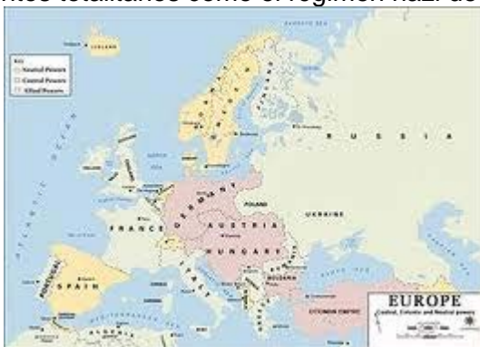
1. Mapa de Europa en 1914

Además, las imposiciones a Alemania favorecieron el deseo de revancha y el auge de movimientos totalitarios como el régimen nazi de Hitler. Hitler habló de la "vergüenza" de Versalles.