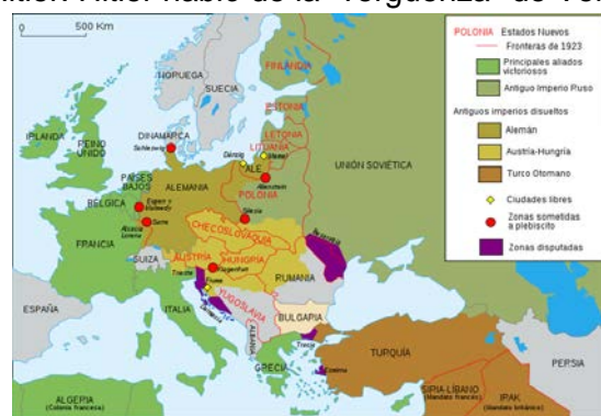
2. Europa tras la I Guerra Mundial

5. Haz un esquema de los cambios producidos en el mapa de Europa tras la I Guerra Mundial indicando: