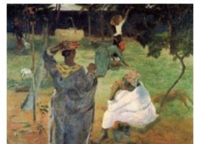
Paul Gauguin: "La recolección de la fruta"

30. Relaciona cada uno de los siguientes rasgos con el arte neoclásico o romántico, según corresponda: