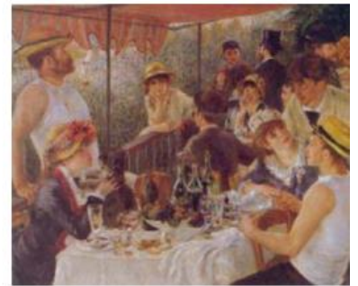
"Le déjeuner des canotiers" (A. Renoir)