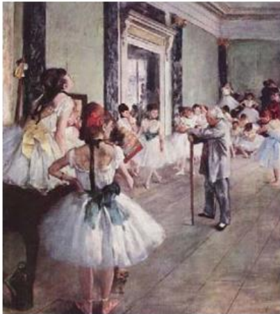
"Clase de baile" (E. Degas)

edificio. Es la época del modernismo , interesado por la Naturaleza y el diseño. Destaquemos a Gaudí y su templo de la Sagrada Familia en Barcelona.