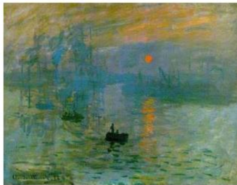
"Impression, soleil levant" (C. Manet)