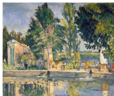
Paul Cezanne: "El estanque"