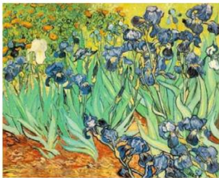
Vicent van Gogh: "Los lirios"