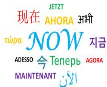
Imagen en Pixabay . Dominio público.