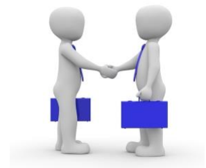
Imagen en Pixabay . Dominio público.

Un caso especial dentro de los contratos indefinidos son los fijos-discontinuos , que se establecen para realizar trabajos periódicos de naturaleza discontinua, pero que no se repiten en fechas ciertas. De esa forma, los trabajadores saben más o menos la temporada que van a trabajar y las empresas los llaman cuando lo necesitan. Muchos de estos contratos se relacionan con los sectores turístico y agrícola.