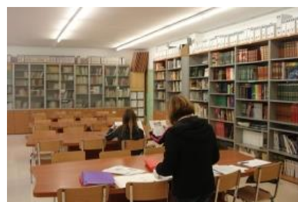
Imagen de Juan 0970 en Wikimedia Commons . Licencia CC .

4) Además, puedes optar por las enseñanzas de régimen especial que se ofertan en el campo de las Enseñanzas Artísticas, en el de las Enseñanzas Deportivas o en el de los idiomas.