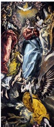
Detalle de la Inmaculada

Doménikos Theokópoulos, El Greco , nacido en Creta y con residencia en Toledo, será el pintor más representativo, con un estilo fácilmente identificable, por el gusto por el dibujo de figuras alargadas, muy espirituales y de mucho colorido. Su estilo se identifica con el espíritu de la Contrarreforma. Es considerado en la actualidad uno de los más grandes pintores, aunque durante mucho tiempo estuvo minusvalorado.