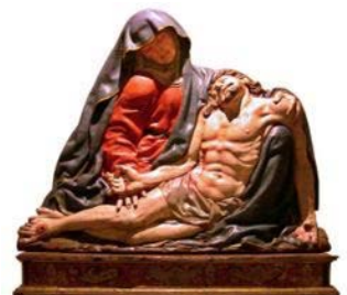
La Piedad de Medina del Campo, de Juan de Juni