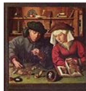
La Edad Moderna fue el origen del capitalismo, impulsado por una burguesía que aspiraba a conquistar el poder político

En el siglo XVIII la recuperación económica fue general. Aparecieron nuevas teorías económicas como el liberalismo , que, como su nombre indica se basaba en la libertad, proponiendo que el Estado no interviniera en la actividad económica y que esta fuera desarrollada únicamente por la empresa privada.