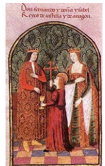
Los Reyes Católicos

Los Consejos fueron su principal instrumento de gobierno, las Cortes quedaron en un segundo plano.