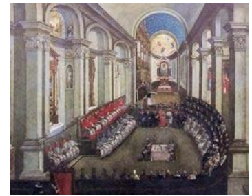
Reunión del Concilio de Trento

Fue la reacción de la iglesia católica para hacer frente a la Reforma protestante. En el Concilio de Trento (1545-1563) se rechazaron las doctrinas protestantes y se confirmó la doctrina católica en los temas que habían sido objeto de duda. Se crearon nuevas órdenes religiosas, destacando la Compañía de Jesús que se dedicaría a la educación para transmitir el dogma católico.