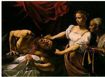
Judith decapitando a Holofernes, de Caravaggio.