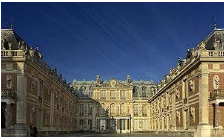
Palacio de Versailles, de Jules Hardouin Mansart

Entre las obras civiles de la arquitectura barroca destaca el Palacio de Versailles.