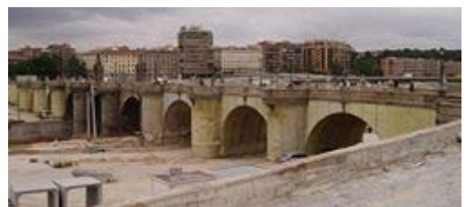
Puente de Toledo, en Madrid, obra de Pedro de Ribera