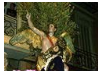
La oración en el huerto, de Salzillo

Los rasgos más característicos de sus obras son el movimiento, el color y el realismo.