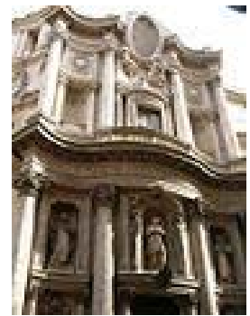
San Carlos de las Cuatro Fuentes, de Borromini

Arquitectos destacados del Barroco, fueron: Bernini , Borromini, Carlos Maderna y Mansart.