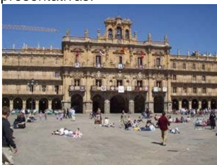
Plaza Mayor de Salamanca, de Alberto de Churriguera

Sus mejores representantes fueron la familia Churriguera (arquitectos y escultores), por ellos se emplea el término "churrigueresco" como algo muy recargado. En las imágenes tienes dos obras representativas.