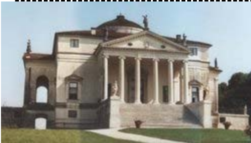
Villa Rotonda de Andrea Palladio