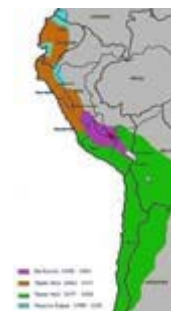
Incas, en el corazón de los Andes