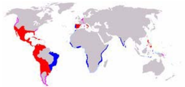
El imperio de Felipe II tras la anexión de Portugal y sus colonias