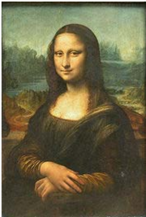
La Mona Lisa, de Leonardo da Vinci

Estos tres autores son los maestros italianos, aunque tienen su precedente con Fra Angélico y Botticelli , entre otros.