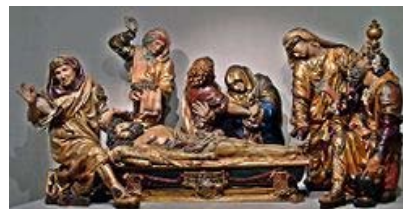
El Santo Entierro, de Juan de Juni