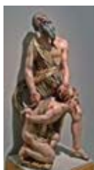
El sacrificio de Isaac, de Alonso Berruguete

Utiliza como material la madera policromada y los temas que predominan son religiosos. Destacamos a dos autores, Alonso Berruguete y Juan de Juni , cuyas esculturas se caracterizan por la expresividad y el movimiento.