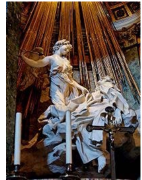
Éxtasis de Santa Teresa, de Bernini.

Autores: escuela italiana, Caravaggio ; escuela flamenca, Rubens ; escuela holandesa: Rembrandt .