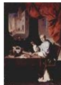
Fray Gonzalo de Illescas, de Zurbarán

Francisco de Zurbarán centró su labor en Extremadura en la sacristía del monasterio de Guadalupe. También hay obras suyas en la iglesia de Bienvenida o en el Museo de Badajoz.