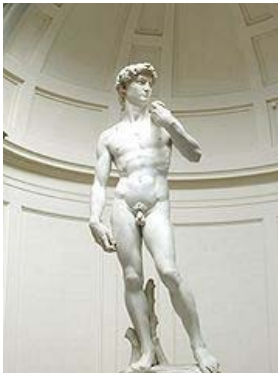
David, de Miguel Ángel

En la escultura del David se sintetizan las características de la escultura renacentista: