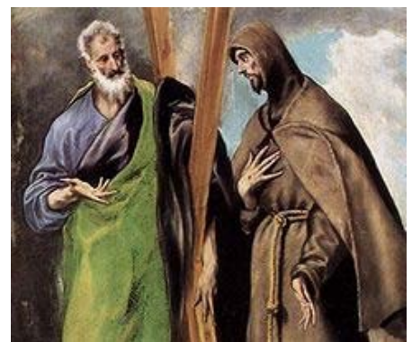
Detalle de San Andrés y San Francisco