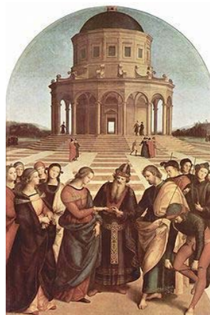
Los desposorios de la Virgen, de Rafael