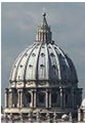
Cúpula de la capilla de San Pedro, de Miguel Ángel