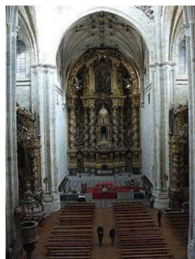
Retablo del convento de San Esteban, en Salamanca, de José de Churriguera