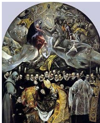
El entierro del conde de Orgaz