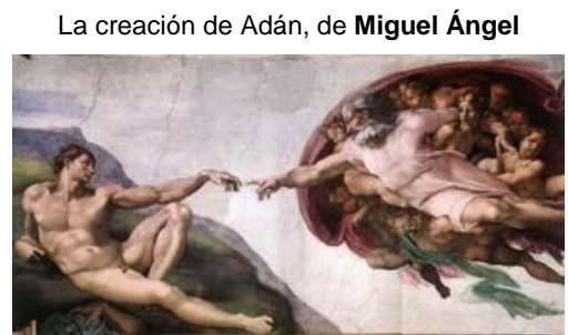
La creación de Adán, de Miguel Ángel