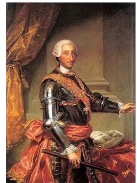
Carlos III fue déspota ilustrado