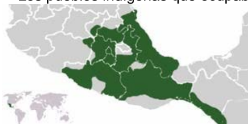
Mayas, en la península de Yucatán

Los pueblos indígenas que ocupaban estos territorios eran: