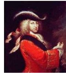
Felipe de Anjou , un Borbón, nieto de Luis XIV de Francia

En España estalló una guerra civil, pues había partidarios de ambos candidatos, fuera de España fue una guerra internacional en la que se involucraron casi todos los países de Europa. Esta guerra concluyó con la Paz de Utrecht (1713) por la que Felipe V fue reconocido como rey de España. Los países europeos se repartieron gran parte de los territorios españoles y se acordó que las monarquías española y francesa no pudieran unirse bajo un mismo monarca.