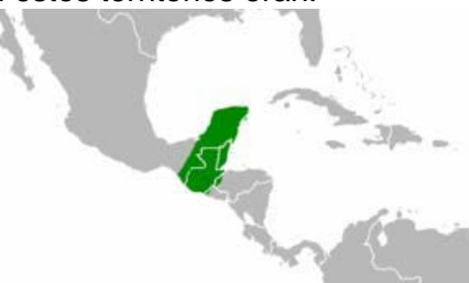
Aztecas, en Valle de Méjico