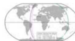
La línea rosada marcaba la división de territorios según el Tratado de Tordesillas