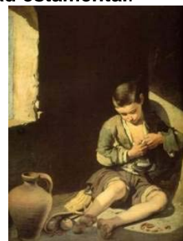
En las ciudades vivía un gran número de pobres, como este niño mendigo retratado por Murillo

El siglo XVII fue época de grandes conflictos en Europa, pues debido a la crisis, los privilegiados