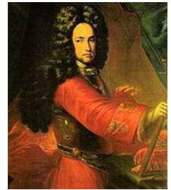
El Archiduque Carlos , un Habsburgo y futuro emperador Carlos VI de Alemania

Lee a continuación una de las cláusulas del Tratado de Utrecht. Desde entonces, Gibraltar es británico.