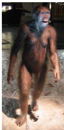
Australopithecus afarensis (Lucy)

Gracias a Darwin y a otros científicos que continuaron con su labor sabemos hoy que los seres vivos actuales, incluidos los seres humanos, son el resultado de millones de años de evolución , es decir, de cambios genéticos que se producen en una especie y que suelen facilitar la adaptación de la misma al entorno que le rodea.