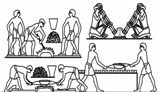
Mural egipcio: Fundición del cobre

Los avances tecnológicos conseguidos por el hombre van aumentando a medida que descubre la existencia de nuevas materias primas. En la denominada Edad de los Metales , comienza la fabricación de utensilios de metal, que acabarán sustituyendo a los más primitivos instrumentos de piedra.