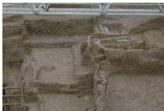
Skara Brae (Escocia): es la ciudad más completa del Neolítico que se conserva en Europa.

10. ¿En qué año se desarrolla la Edad de los Metales en la Península Ibérica?