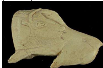
Bisonte tallado en hueso (Francia)