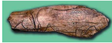
Hueso con caballos, El Pendo (Cantabria)