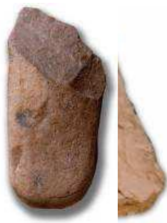
Útiles Paleolíticos: muy rudimentarios.

mucho más elaborados que los que conocemos del Paleolítico.