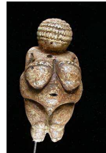
Venus de Willendorf tallada en piedra (Austria)

La palabra neolítico significa piedra nueva . Se conoce así este período de la Historia porque en él, por primera vez, se va a trabajar la piedra, puliéndola; a diferencia del Paleolítico en el que, simplemente, se golpeaba para fabricar los útiles.