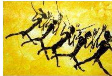
Escena de guerreros, Cueva Cingle (Castellón)