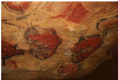
Bisontes en el techo de la cueva de Altamira, Santillana del Mar (Cantabria)

El tema principal son los animales o los signos llamados ideomorfos, pero también la figura humana. Para realizarlas se valían de pigmentos minerales y sangre de animales con los que conseguían tonos ocre, marrones, rojizos y amarillentos. Además, utilizaban el carbón vegetal para las líneas negras. Como pincel, usaron los dedos. Casi todas las imágenes están en las zonas más profundas de las cuevas.