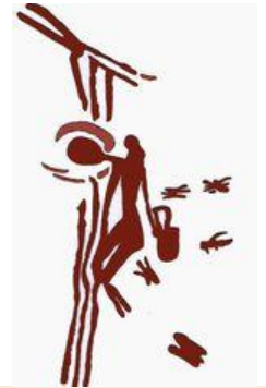
Individuo recolectando miel, Cueva de la Araña, en Bicorp (Valencia)

En Extremadura encontramos los siguientes yacimientos: