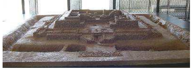
Maqueta de Cancho Roano