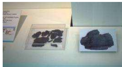
Fragmentos de textil Catal Hüyük (Turquía)