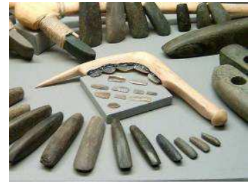
Útiles Neolíticos . Éstos son mucho más elaborados y adaptados a las exigencias de las nuevas actividades

El cultivo de la tierra trajo consigo nuevos inventos : la azada (para cavar), la hoz (para segar los cereales), el molino de piedra (para moler).