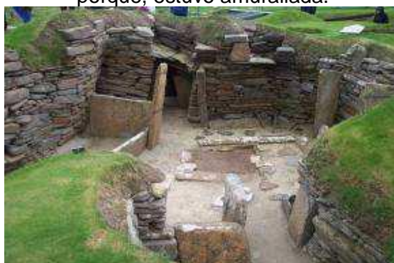
Catal Hüyük (Turquía): conjunto de calles sin ninguna organización. El acceso hasta las casas se realizaba a través del tejado.