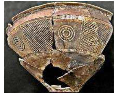
Cerámica de "punto en raya" o de Boquique (Plasencia)

Mientras las pinturas paleolíticas aparecen en las zonas más profundas de las cuevas, las neolíticas, por el contrario, se realizaban en abrigos en el exterior. Son de carácter esquemático.