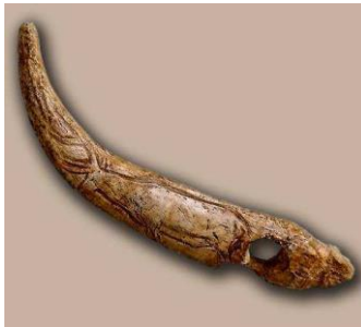
Ciervo grabado, bastón perforado, cueva del Castillo (Cantabria)