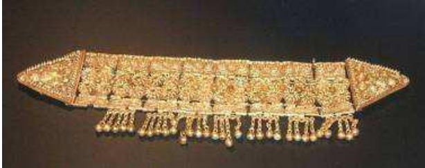
Diadema del Tesoro de Aliseda

Celtíberos (Meseta). Pueblos agrícolas y guerreros. Muy jerarquizados socialmente, seguían a su jefe hasta la muerte.