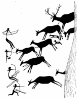
Escena de caza, Cueva de los Caballos (Castellón)

La zona de Levante es el lugar de mayor concentración de yacimientos rupestres de Europa.