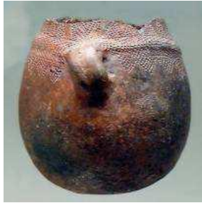
Cerámica cardial (Valencia)