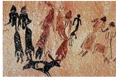
Danza, abrigo de Cogull (Lérida)