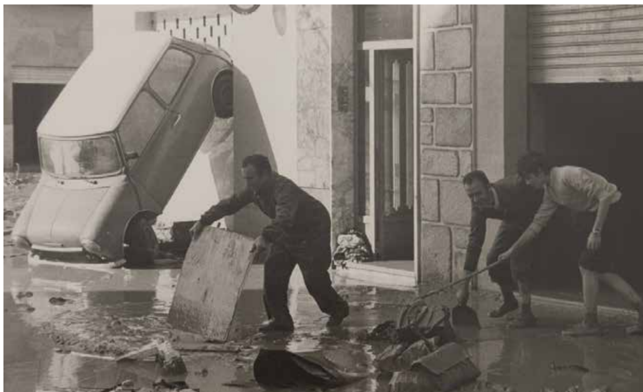
Un moment de les tasques de neteja després del pas de l'aigua a la Ribera Alta.

El temporal Glòria va matar cinc persones per les fortes ràfegues de vent