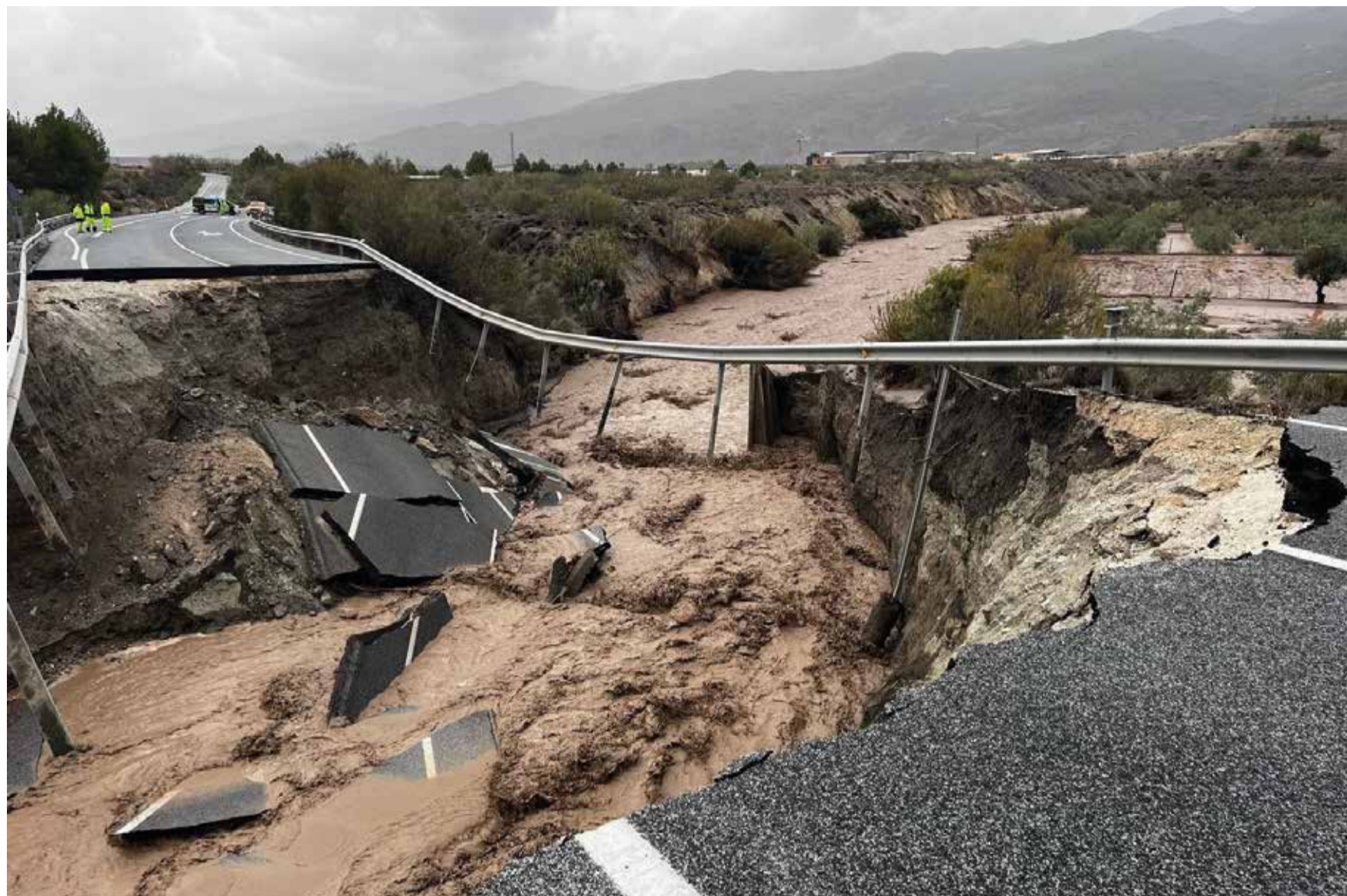
Un exemple de l'impacte de la DANA en les carreteres del territori.