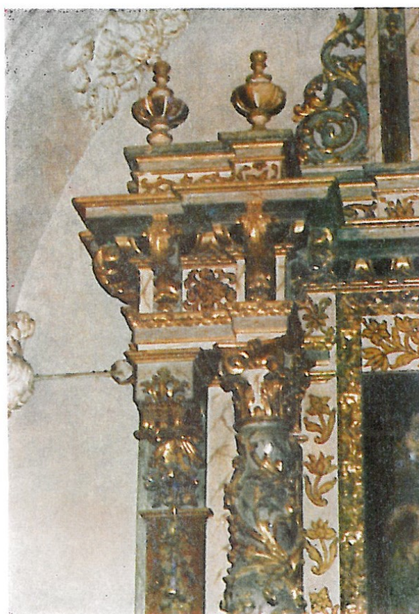
Detalles del retablo barroco, en madera tallada y policromada, dedicado a San Francisco de Borja. ( Ilustraciones del Apéndice VIII )