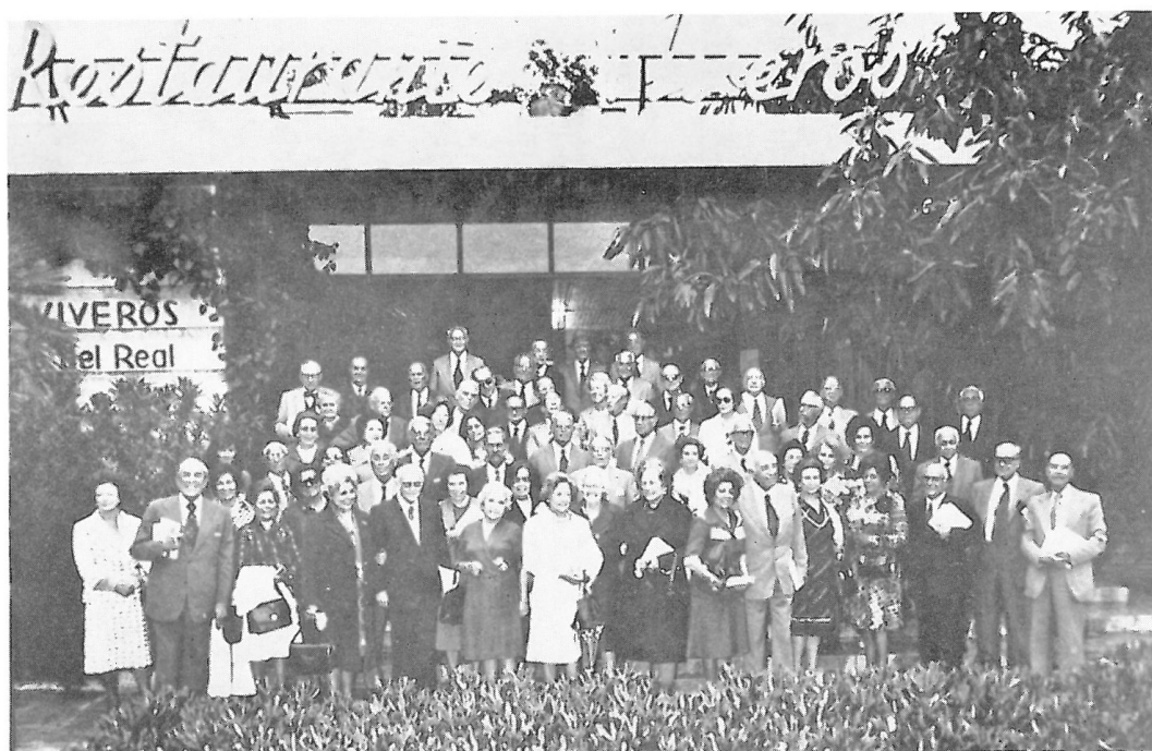
Grupo de la promoción de Bachilleres de 1925, con motivo de sus Bodas de Oro (Ilustración del Apéndice XXI)