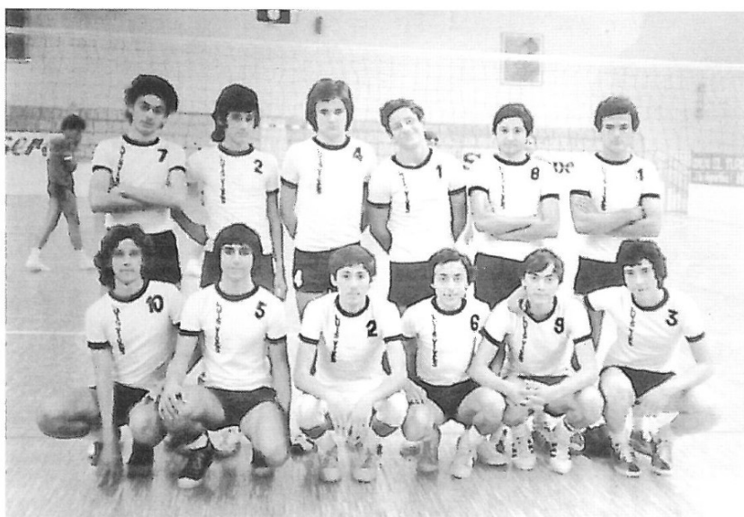
Equipo "Luis Vives A" cadete campeón provincial de los Juegos Escolares Nacionales. Curso 1974-1975.