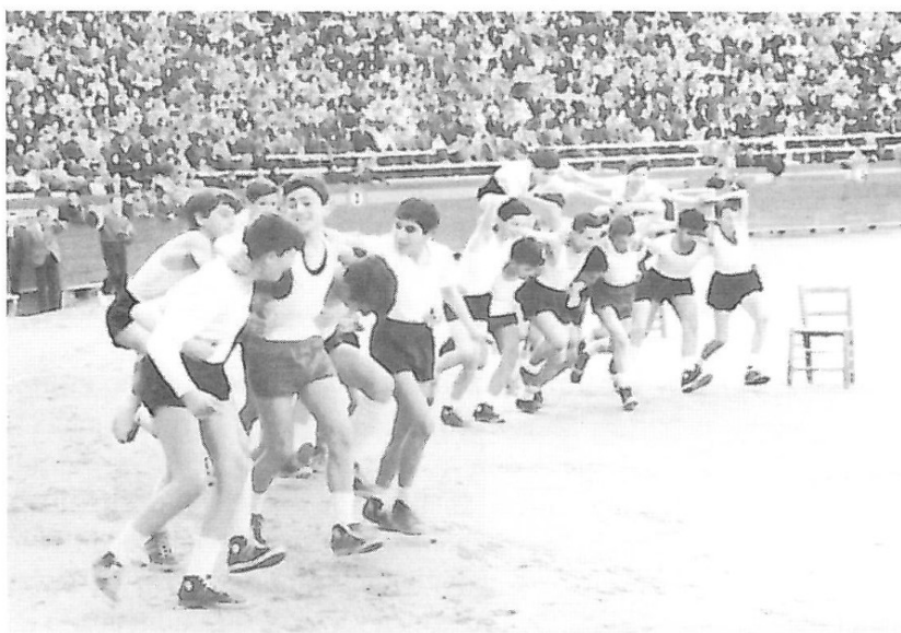
Comienza la carrera de cuadúpos.