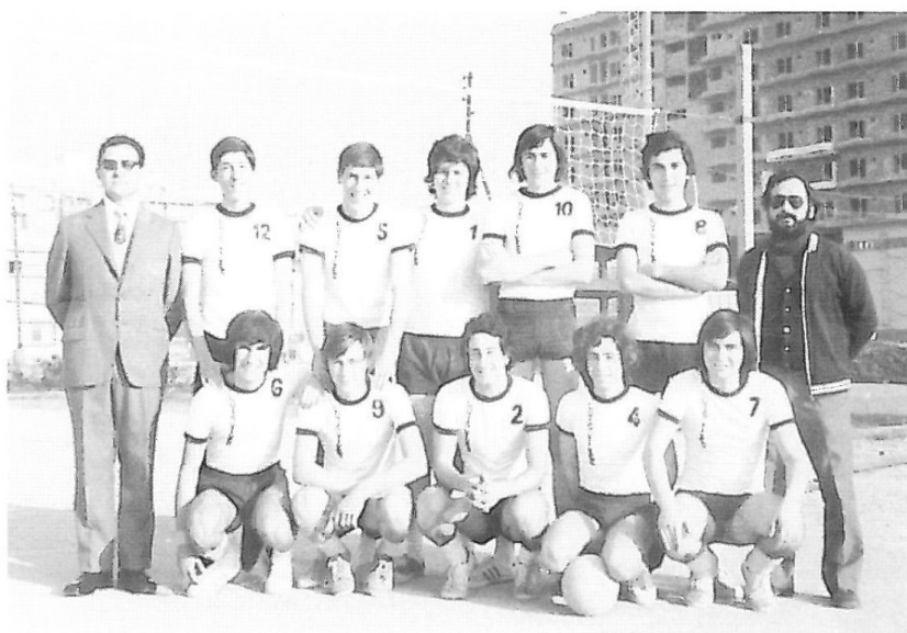
Voleibol Juvenil Federado. Antes del encuentro.

La verdad es que, descontando de los 60 minutos asignados para una clase el tiempo necesario que se emplea por los Alumnos para salir del aula de la clase anterior, presentarse en el vestuario, cambiarse de atuendo, presentarse en el lugar de comienzo de la sesión de trabajo, regreso al vestuario, ducharse, vestirse de nuevo y presentarse otra vez en su aula puntualmente, (entre 20 y 25 minutos), solamente quedan para trabajar unos 35-40 minutos, dos veces por semana. ¡¡Una miseria!! Pese a ello, los Alumnos se sentían muy mejorados, por lo que trabajaban con gran interés y dedicación. Estoy muy contento de haber impartido mis clases a Alumnos tan estupendos. Espero no haberles defraudado. Disfrutaba en clase.