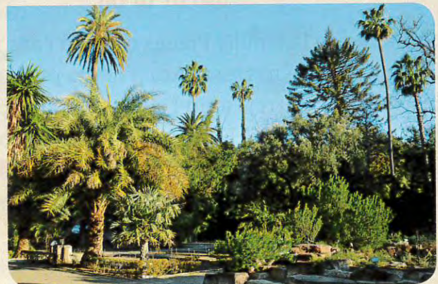
Interior del Jardí Botànic de València, el més antic d'Espanya.