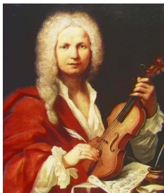
Musicograma "El Otoño" de Vivaldi

ACÍ TENIU UN MUSICOGRAMA I UNA PERCUSSIÓ CORPORAL DE DUES CANÇONS QUE HEM ESCOLTAT EN LA SIRENA MUSICAL