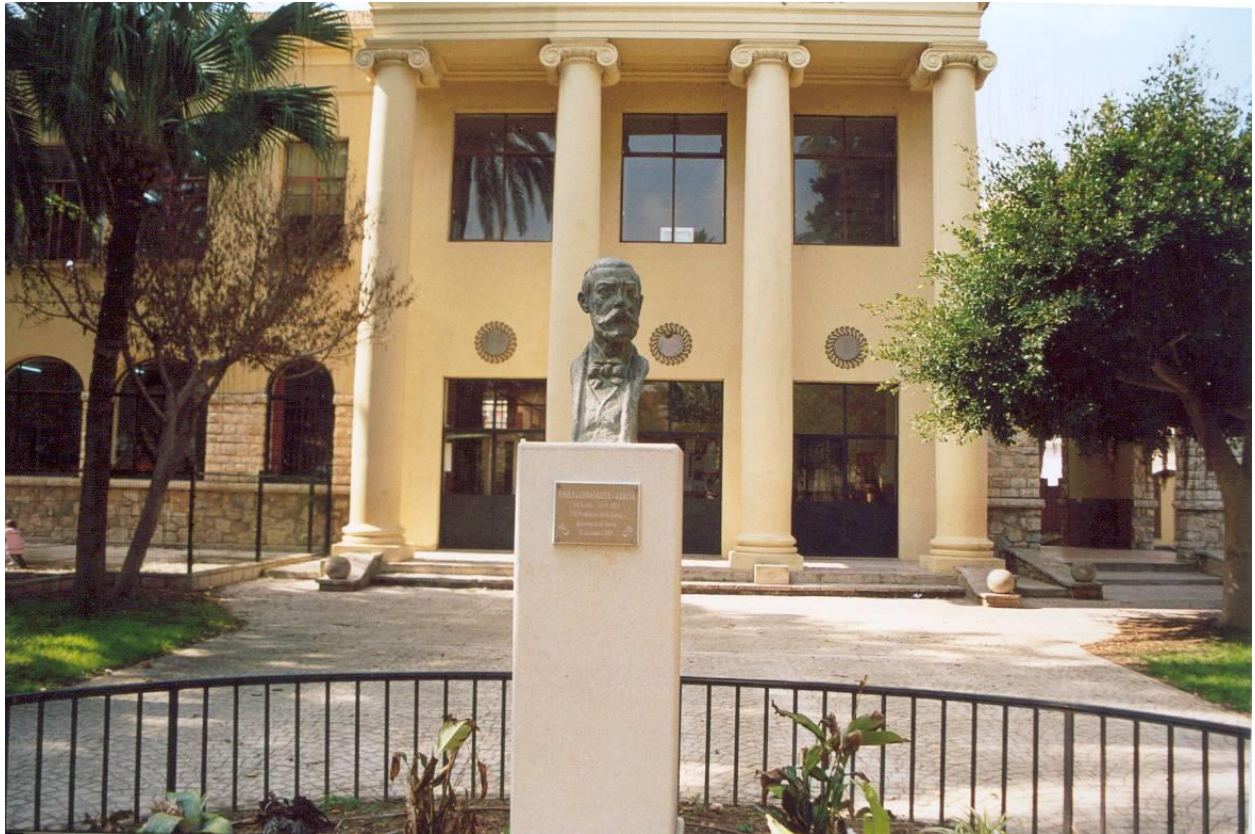
Bust de D. Emilio realitzat per José Marco Cuevas situat avui al jardí on antigament estava la font