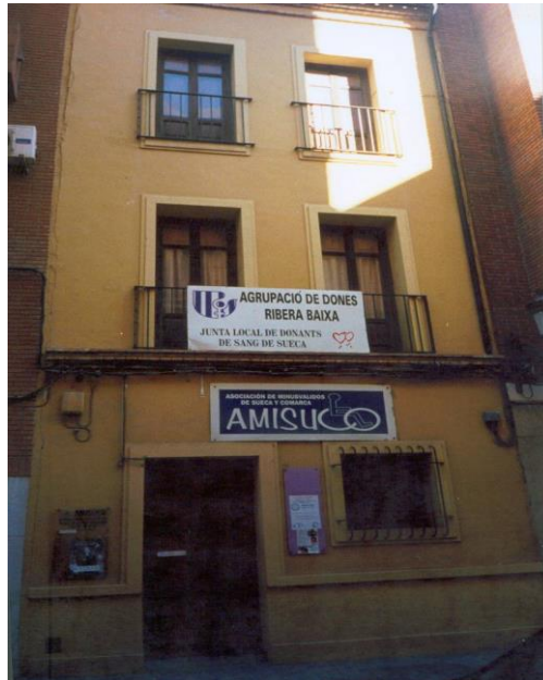
La casa de D. Emilio del Carrer València, en l'actualitat

Ràfol; 2 fanecades i 31 braces de terra per a planter d'arròs en la partida de les Sauselles; 3 fanecades, 3 quartons i 26 braces de terra d'horta en la partida de la Pedra de Montó o Sènia; 13 fanecades de terra arrossar en la partida de Regatxo; 5 fanecades i 17 braces de terra, abans olivar i ara de terra campa, a Vilella; i 15 fanecades de terra arrossar en el terme de Sollana, partida del Canyar de Blasco o Campillo.