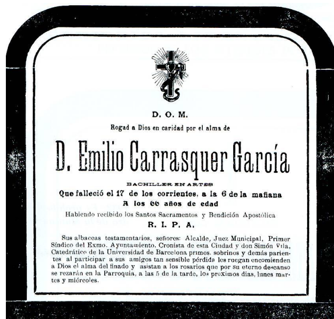
Esquela que publicà el setmanari "El Sueco" en 25-02-1923