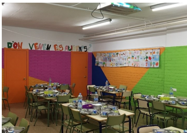
Puçol a 5 de juliol de 2021

19.- Les faltes de convivència, per indisciplina, en l'espai de temps comprés entre les 14:00 i les 15:30 hores, seran tractades segons el que preveu el Reglament de Règim Intern i en el Projecte Educatiu del centre.