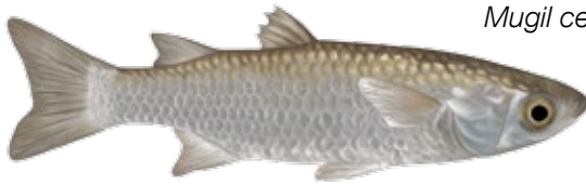
Pardete Llisa de cap gros Mugil cephalus