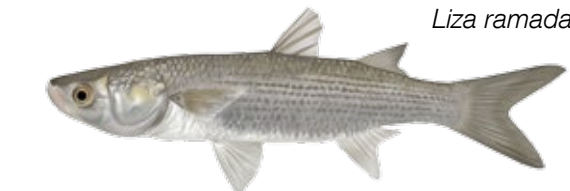
Capitón Sama Liza ramada