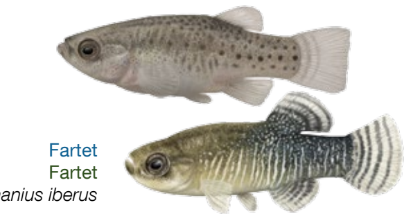
Fartet Fartet Aphanius iberus