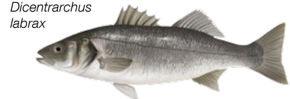
Lubina Llobarro Dicentrarchus labrax