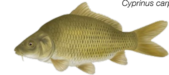
Carpa Carpa Cyprinus carpio