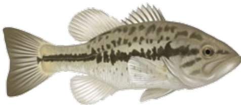
Perca americana Perca americana Micropterus salmoides