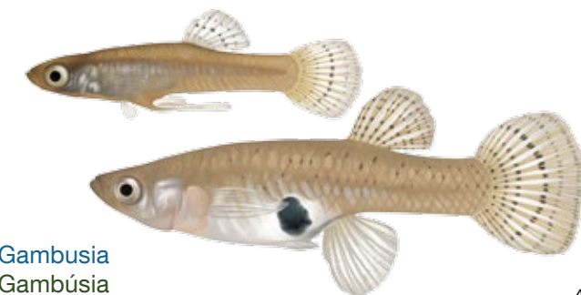
Gambusia Gambúsia Gambusia holbrooki