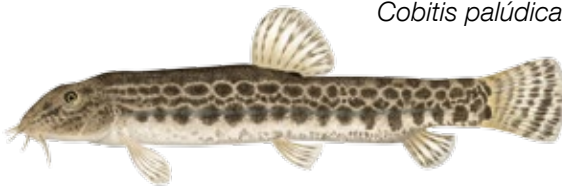
Colmilleja Raboseta Cobitis palúdica