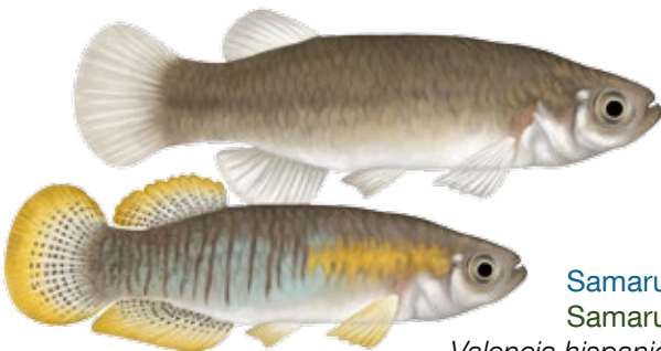
Samaruc Samaruc Valencia hispanica