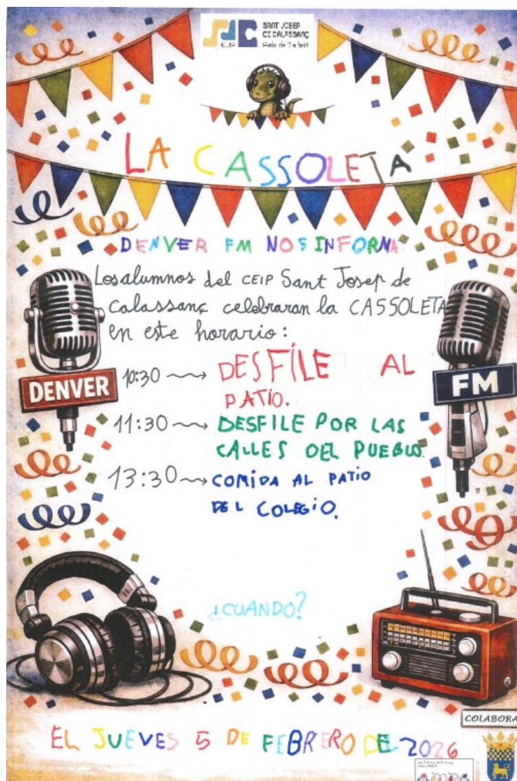
Cartell fet pels alumnes de 1r de primària

Els pares o mares que deixen els seus fills/es a càrrec d'una altra persona per a que se'ls enduguen en acabar de dinar la cassola, ho han de comunicar per web família als tutors/es, indicant qui s'endurà el seu fill/a per a poder tindre un control.