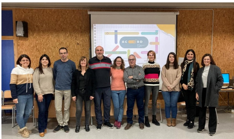
Figures 2 i 3. Diferents moments de les sessions formatives dutes a terme al centre escolar