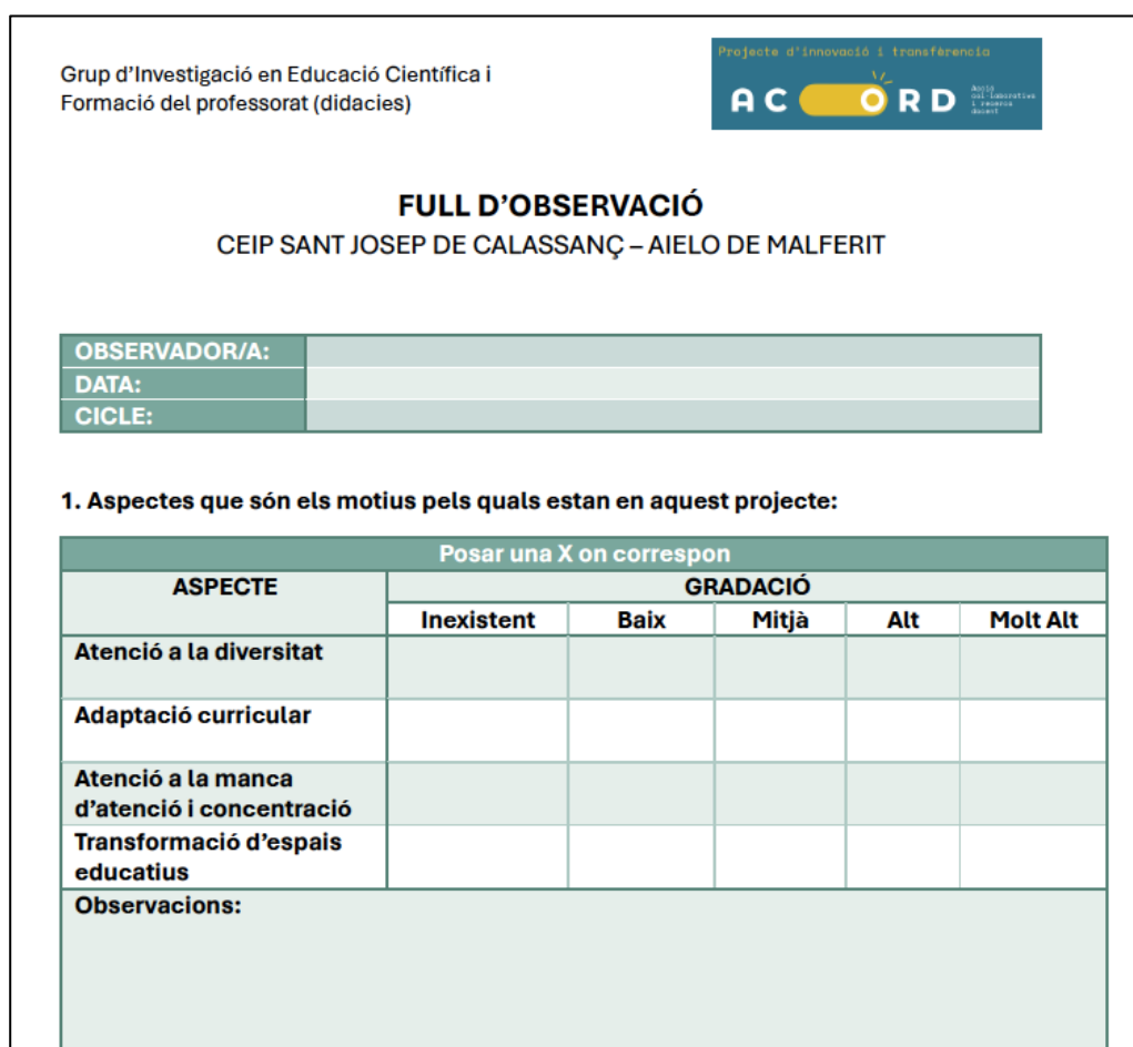
Figura 8. Detall de l'instrument dissenyat per l'equip de la universitat per a avaluar les intervencions didàctiques amb l'alumnat

Un altre aspecte que s'ha tingut molt en compte ha estat la difusió entre la comunitat educativa i el context local i comarcal del treball que s'estava desenvolupat. En aquest sentit es va redactar una nota de premsa que fou publicada (Figura 9) per diversos mitjans de comunicació (Levante-EMV, vilaweb, El diari d'Ontinyent...). També s'ha realitzat un vídeo on s'explica el projecte que estarà allotjat a la web del centre escolar.