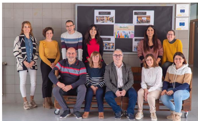
Figura 5. Racó del projecte a l'escola amb tots els membres de l'equip impulsor i el coordinador de l'equip universitari.

També, s'ha creat a l'entrada del centre un racó del projecte on les famílies poden veure el procés i les diferents activitats que es porten a terme al sí del mateix (Figura 5). D'aquesta manera, mantenim la comunicació oberta amb la comunitat escolar com a part imprescindible en el procés de canvi.