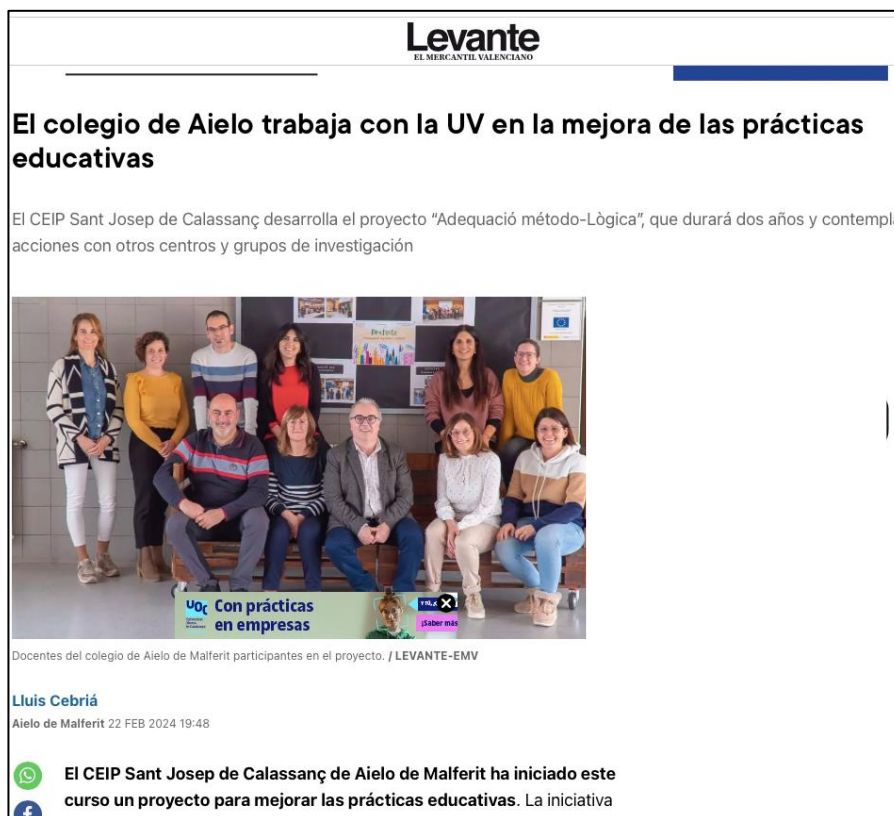
Figura 9. Detall de la notícia apareguda al diari Levante-EMV el 22/02/2024