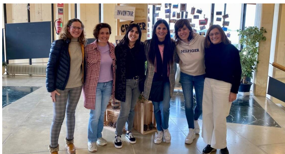
Figura 7. Visita al CEIP "La Patacona" d'Alboraia