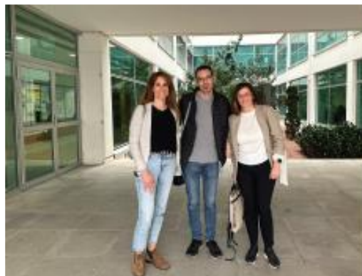
Figura 4. Part del claustre que va participar a la II Setmana d'Activitats Complementàries de la Facultat de Magisteri

També, s'ha creat a l'entrada del centre un racó del projecte on les famílies poden veure el procés i les diferents activitats que es porten a terme al sí del mateix (Figura 5). D'aquesta manera, mantenim la comunicació oberta amb la comunitat escolar com a part imprescindible en el procés de canvi.