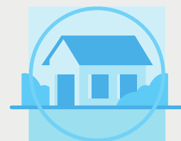
QUEDA'T A CASA