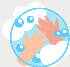
NETEJA'T BÉ LES MANS