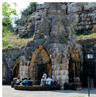
L'aigua: Font d'en Segures i embotelladora de l'Aigua de Benassal El agua: Font d'en Segures y embotelladora del Agua de Benassal