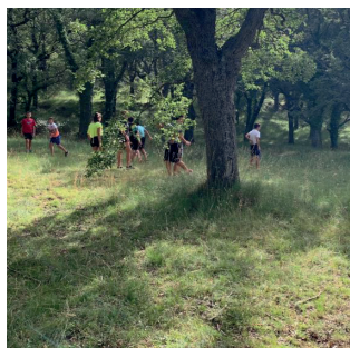
El bosc mediterrani en el Paratge Natural Municipal de El Rivet El bosque mediterráneo en el Paraje Natural Municipal de El Rivet