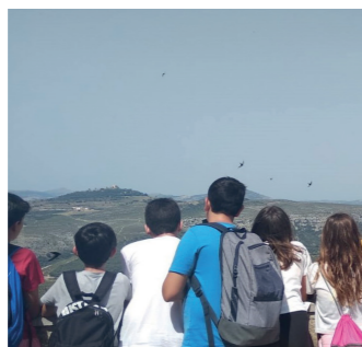
Interpretació del paisatge de la comarca Interpretación del paisaje de la comarca