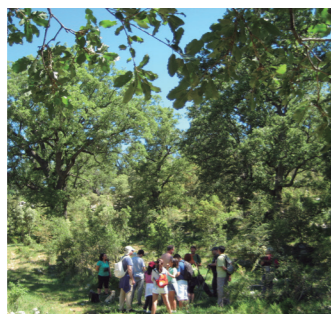
El bosc centenari del Barranc dels Horts El bosque centenario del Barranc dels Horts