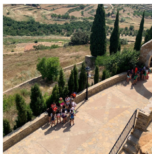
Recorregut històric i sociocultural de Benassal o de Culla Recorrido histórico y sociocultural de Benassal o de Culla