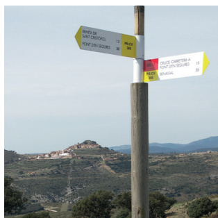
Orientació i localització en Sant Cristòfol Orientación y localización en Sant Cristòfol