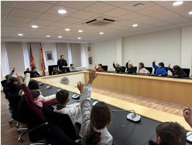
PLENO A L'AJUNTAMENT