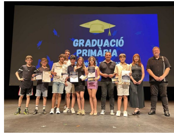
GRADUACIONS INFANTIL I PRIMÀRIA