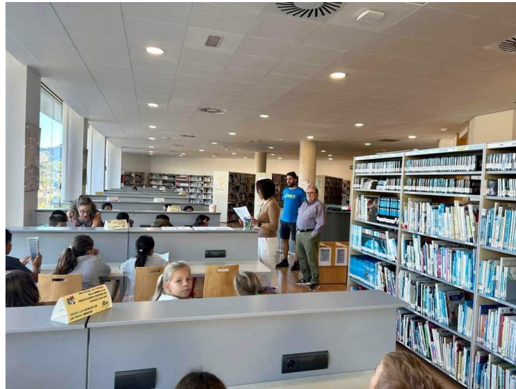
VISITES A LA BIBLIOTECA