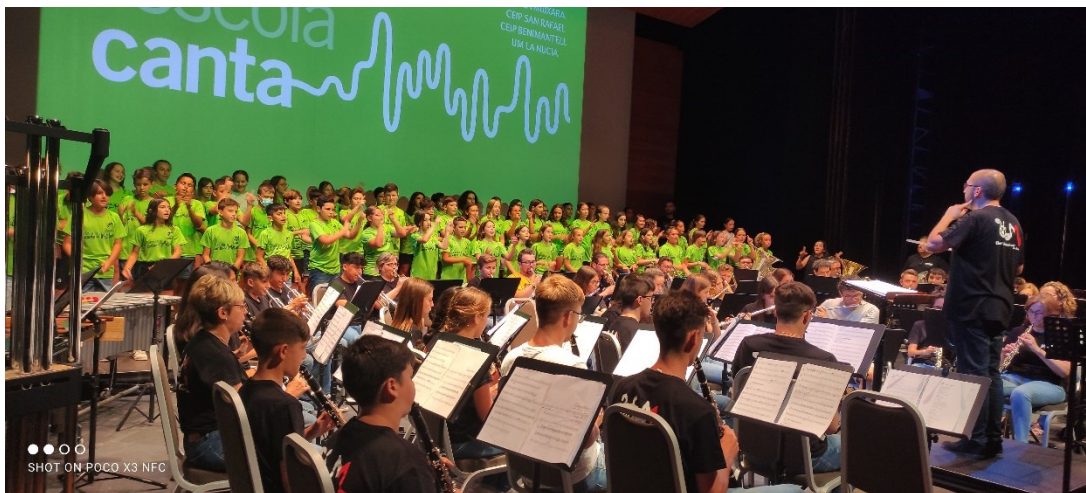
ESCOLA CANTA: BENIMANTELL-SAN RAFAEL-LA MUIXARA