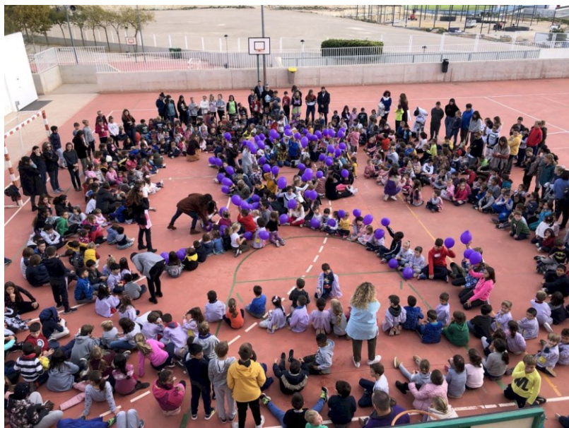
ACTIVITATS 8 Març ( MINUT DE SILENCI)