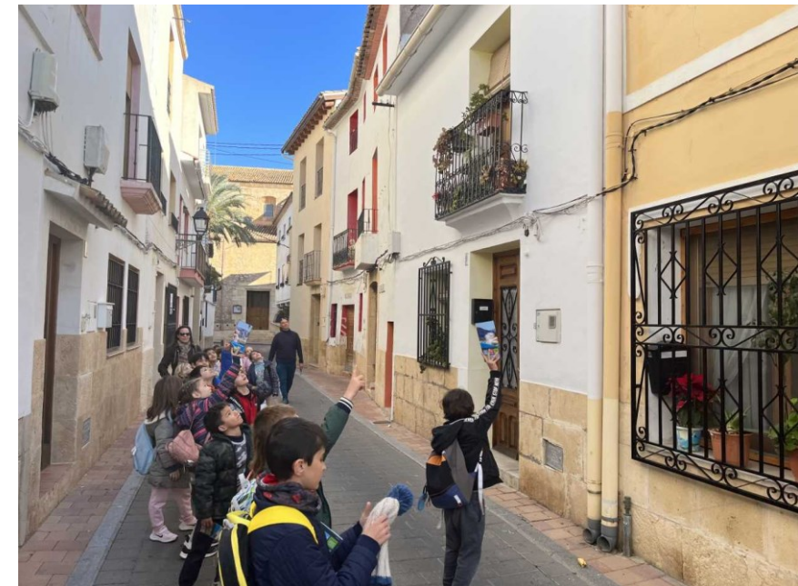
RUTA "EL CASC ANTIC"