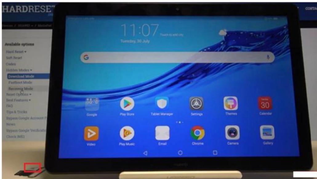
↑ Tarjeta SIM y aguja