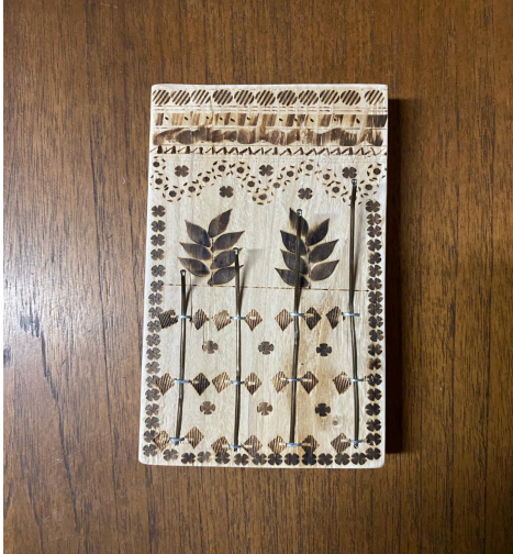
Instrumento musical africano (Sanza)

-Conocimiento de distintos instrumentos africanos ( aprenderemos a interpretar ritmos y melodías)