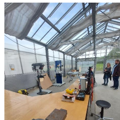
Taller de floristería.