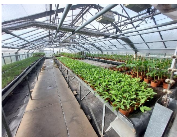
Invernaderos de la estación.