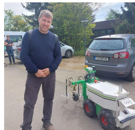
Demostración de robot agrícola.