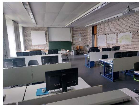
Aula de informática.