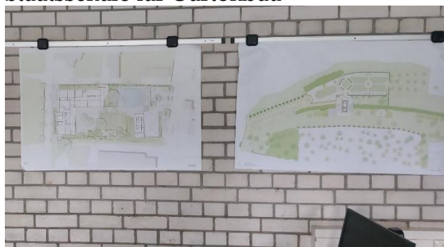
Trabajos del alumnado