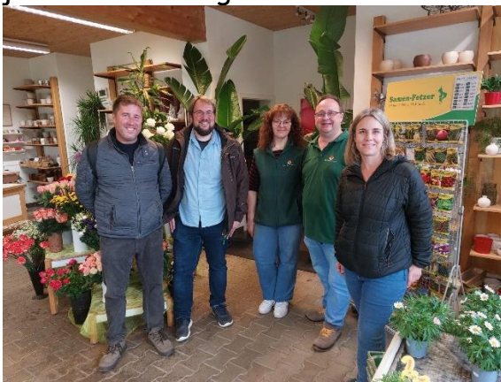
Empresa de floristería.