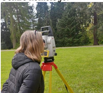
Asistencia a clases de topografía.