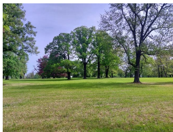
Jardines de Stuttgart.