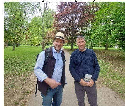
Jardines de Hohenheim.