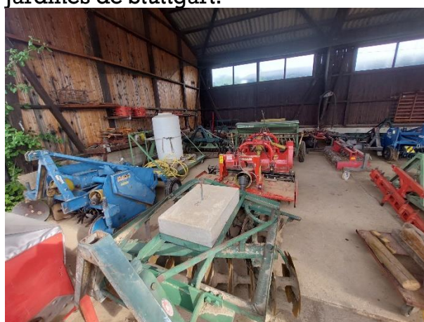
Aperos agrícolas del centro.