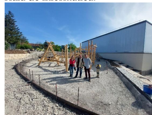
Visita a empresa de paisajismo.