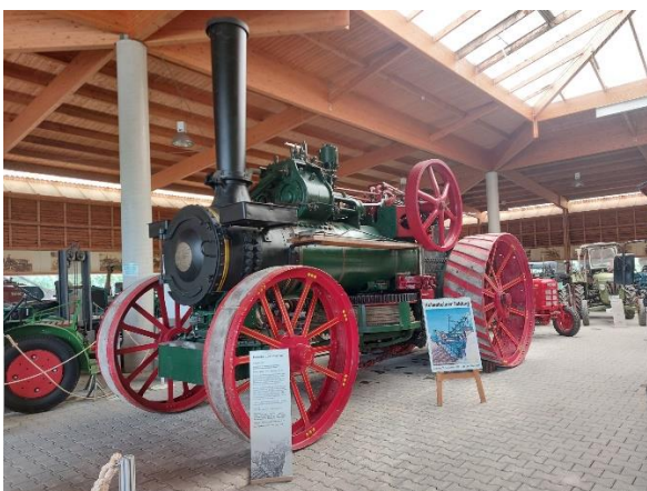
Museo de maquinaria agrícola.