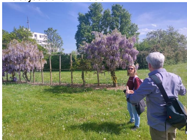
Estación experimental agraria.