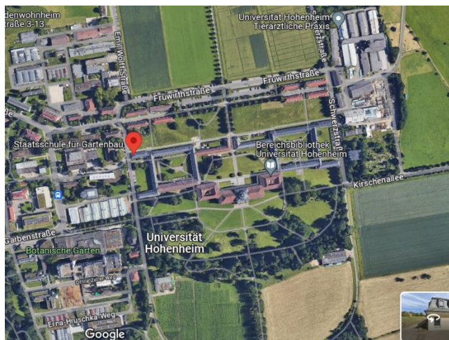
Staatsschule für Gartenbau