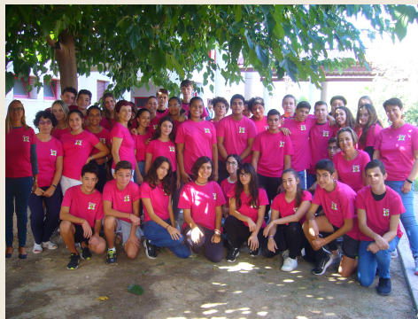
GRUP DE MEDIACIÓ MARIA IBARS

Si fas 4t, batxillerat o cicles i t'interessa ser MEDIADOR/A, parla amb nosaltres. T'ESPEREM!